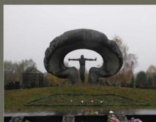
Памятник ликвидаторам на Митинском кладбище в Москве