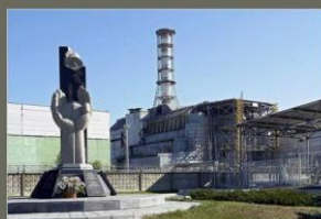
Так выглядит реактор в настоящее время