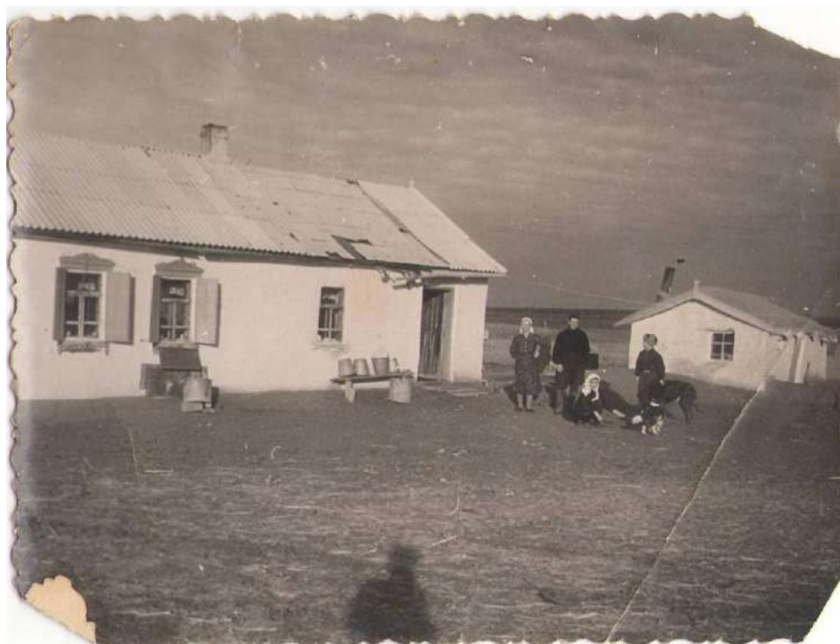
Новый построенный дом после войны. 1956 год. Верхолотовское.